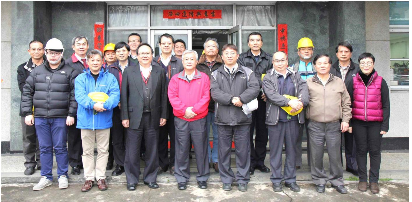
RFID 鋼瓶管理系統觀摩會合照