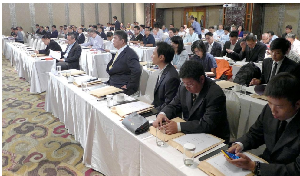
第九屆第一次會員大會(二)