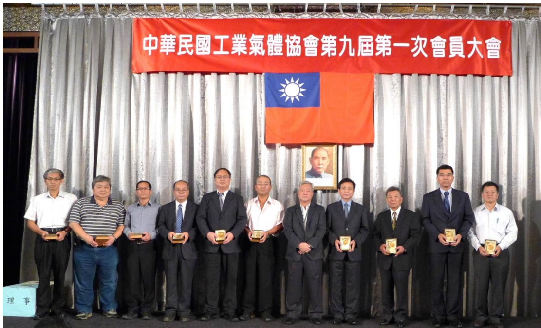
頒獎熱心奉獻優良理事