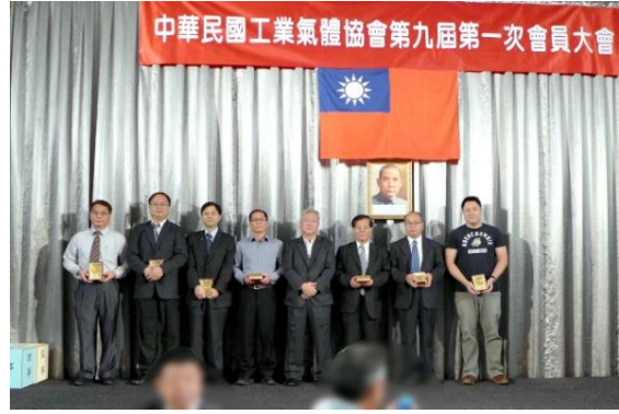
頒獎表揚熱心奉獻技術委員會委員