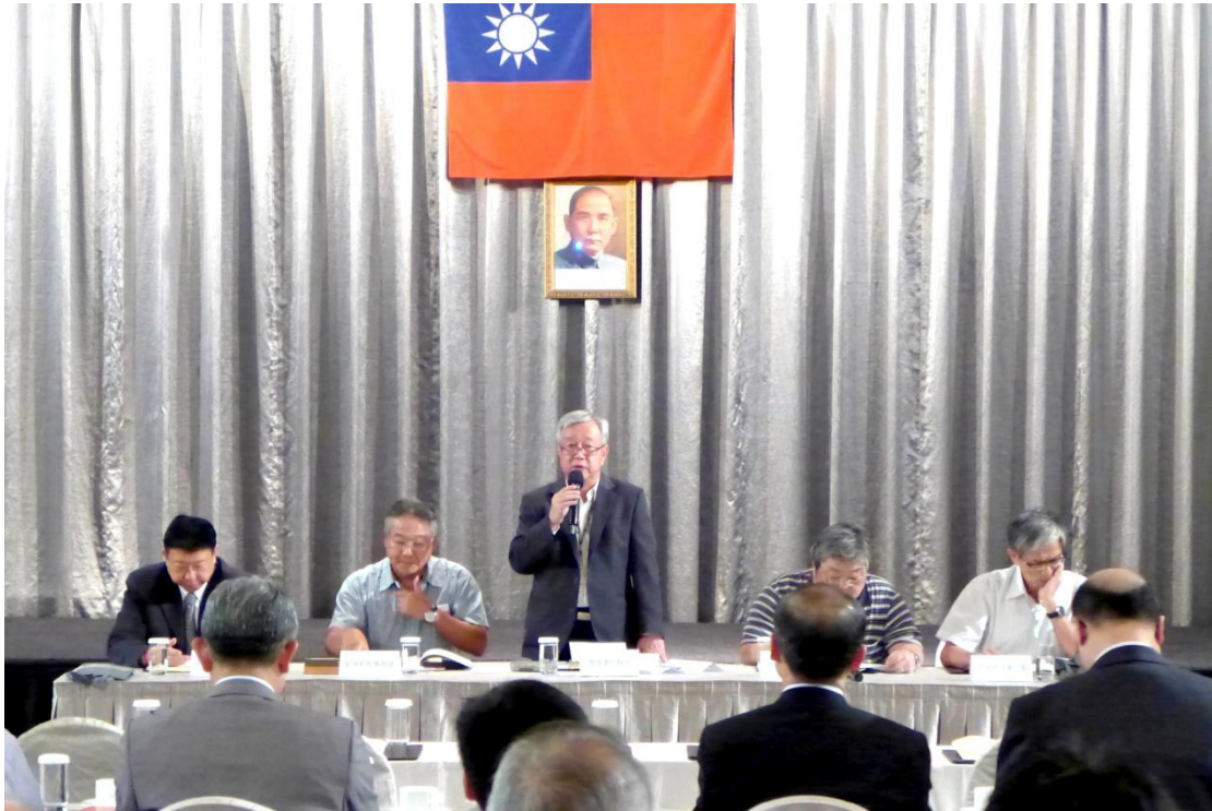
唐前理事長主持大會