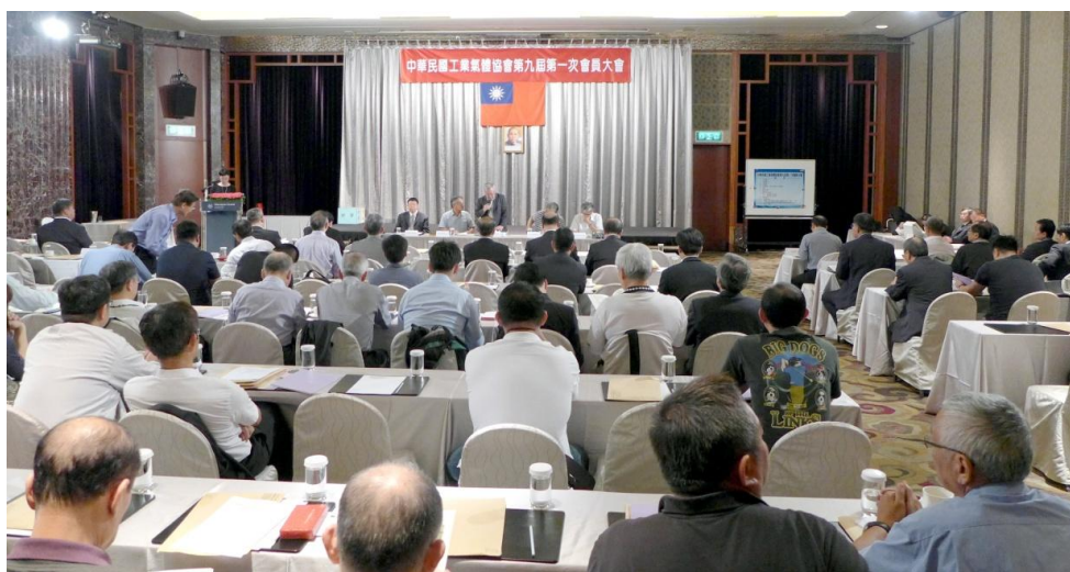
第九屆第一次會員大會(一)

八、未來在各位的支持下，本會將成為政府與產業間最佳的溝通管道、成為國內最佳的容器再檢查輔導單位及成為國內最佳的容器檢驗人員訓練單位，也是國內最佳的容器使用安全推手。