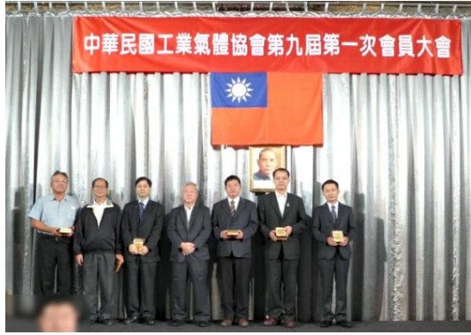
頒獎表揚熱心奉獻監事