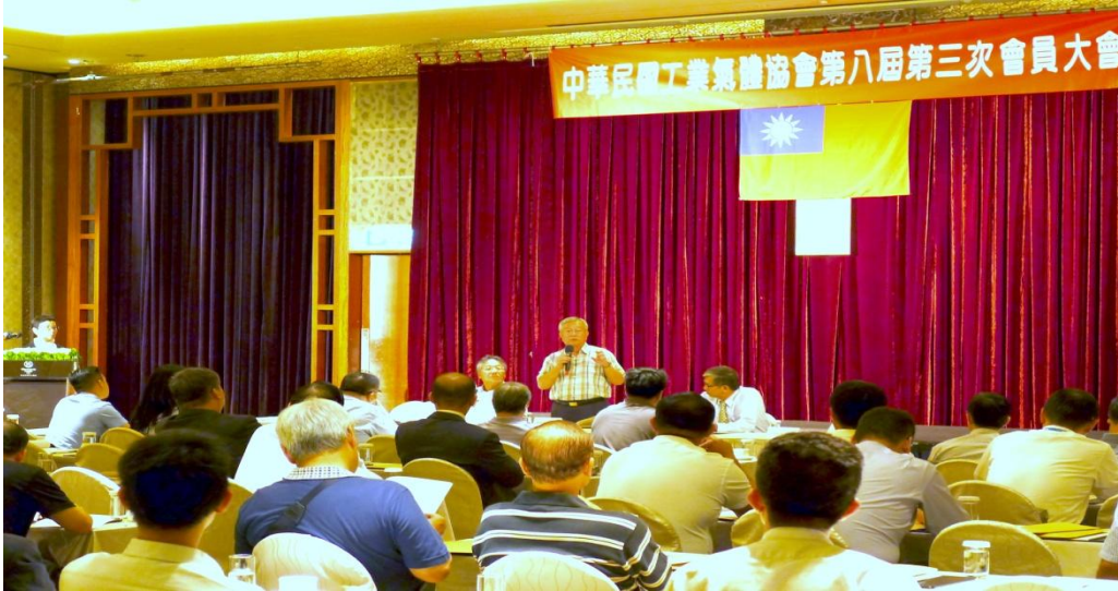
唐理事長主持大會

七、未來在全體會員的支持下，本會在既有的管理基礎上將致力於推動鋼瓶安全管理機制。