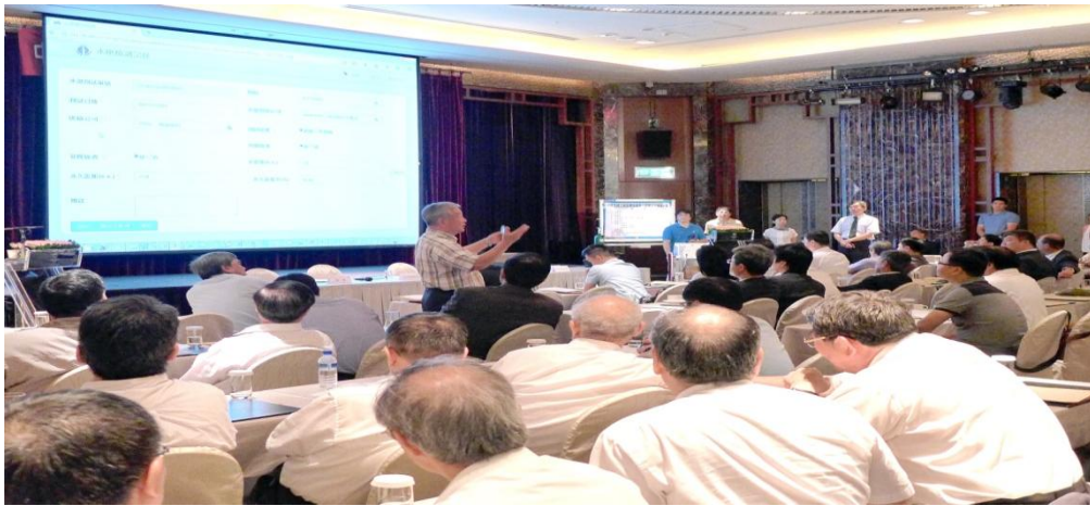
鋼瓶條碼管理系統說明(一)